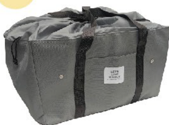
M-15602 ライフビー 保冷エコレジ GY