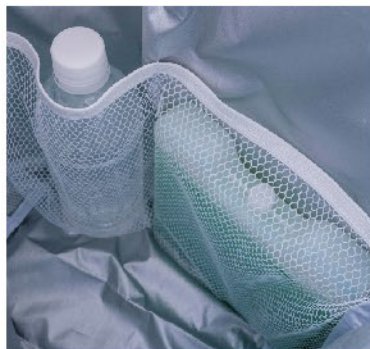
便利な内ポケット付