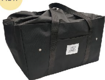
M-15601 ライフビー 保冷エコレジ BK