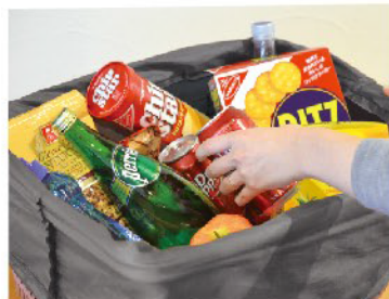
レジカゴにぴったり